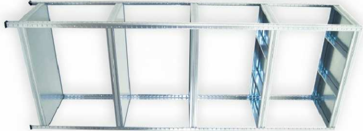
ILUSTRAČNÍ FOTO 3c / 3d