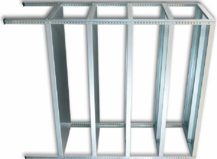
ILUSTRAČNÍ FOTO 3a / 3b /3e